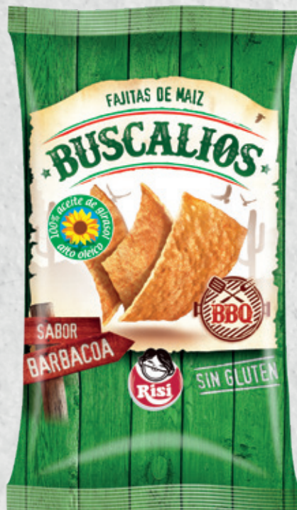
Buscalios BBQ 140 g