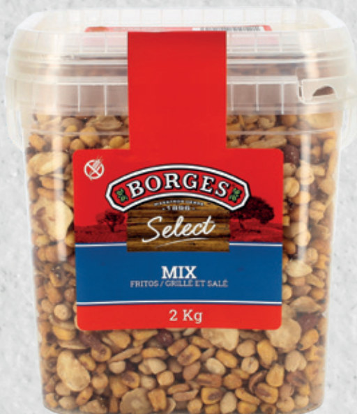
MIX Fritos 2 Kg