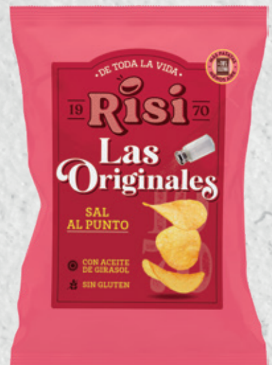
Patatas Originales Sal al Punto 100 g