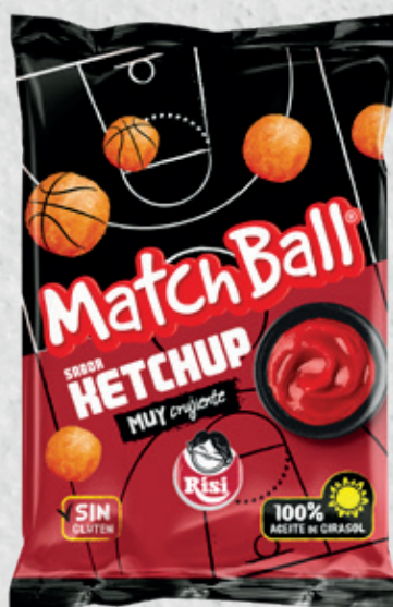
MatchBall Ketchup 105 g