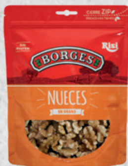
Nueces En Grano 90 g