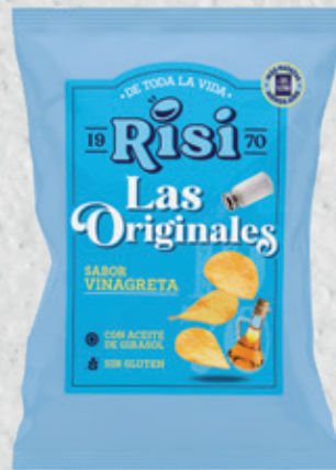
Patatas Originales Vinagreta 40 g