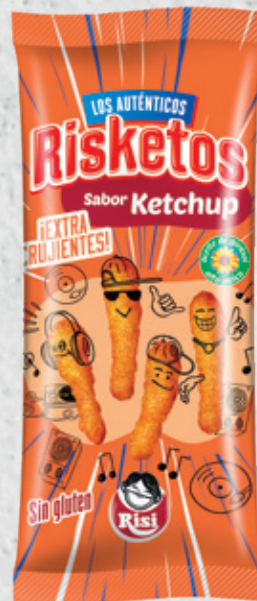
Risketos Ketchup 120 g