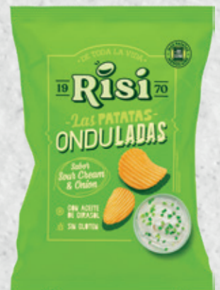
Patatas Onduladas Sour Cream & Onion 100 g