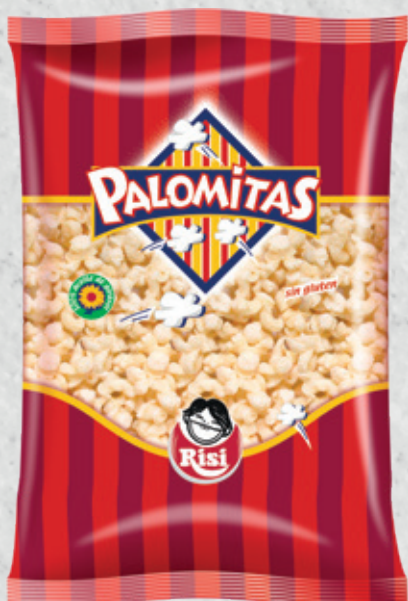
Palomitas 90 g