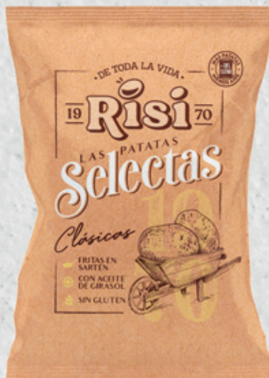
Patatas Selecta Clásica 100 g