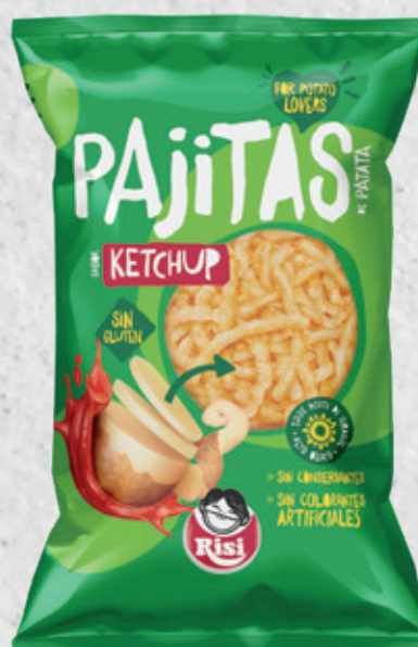
Pajitas de Patata Ketchup 100 g