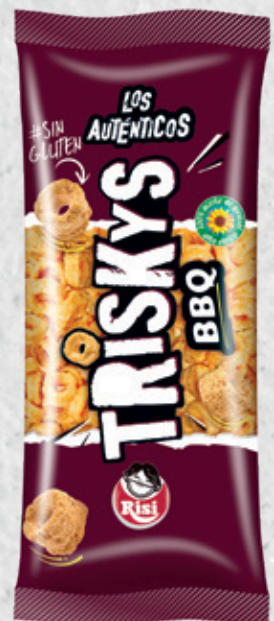
Triskys BBQ 115 g