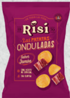
Patatas Onduladas Jamón 40 g