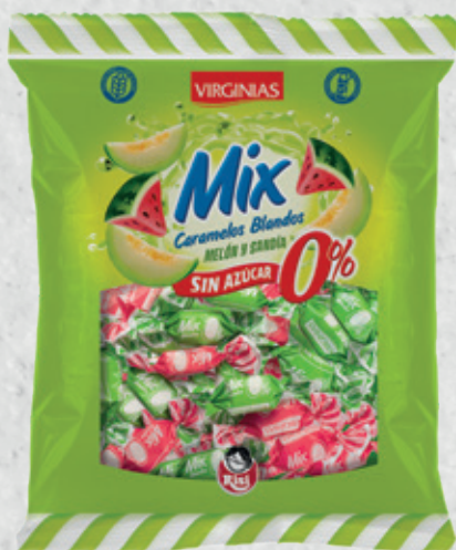
MIX Sin Azúcar 0% Melón y Sandía 70 g