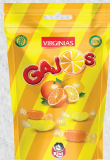
Gajos 70 g