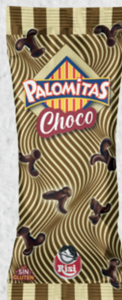
Palomitas Choco 80 g