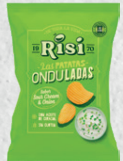
Patatas Onduladas Sour Cream & Onion 40 g