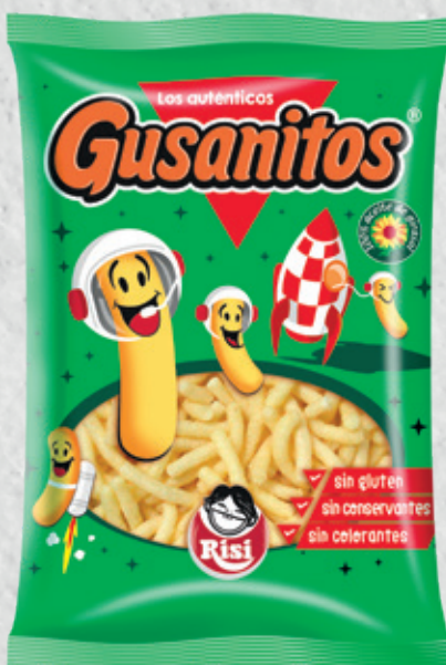
Gusanitos 85 g