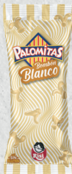
Palomitas Bombón Blanco 80 g