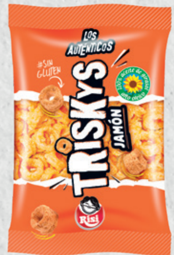
Triskys Jamón 35 g