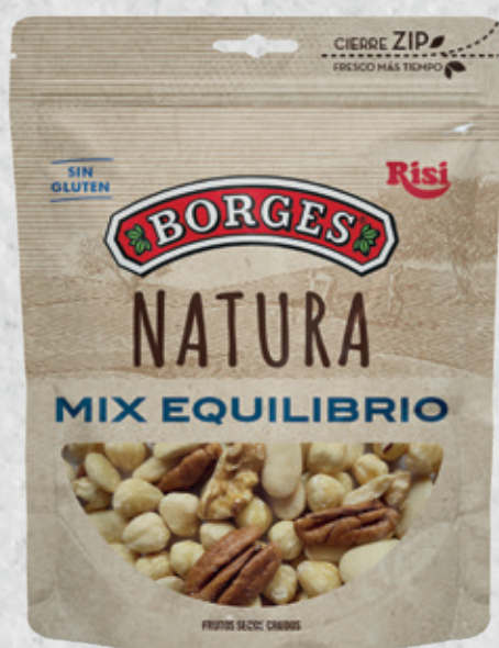
Natura MIX EQUILIBRIO 100 g