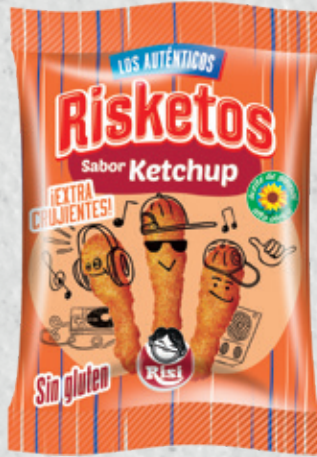
Risketos Ketchup 40 g