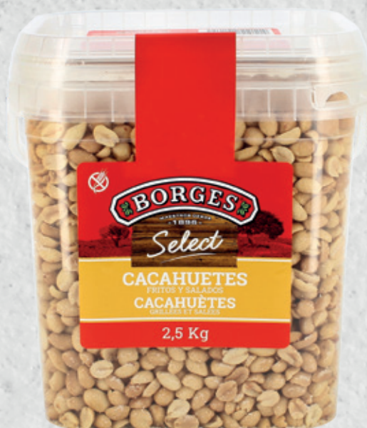
Cacañuetes Fritos y Salados 2,5 Kg