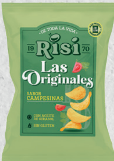
Patatas Originales Campesinas 100 g