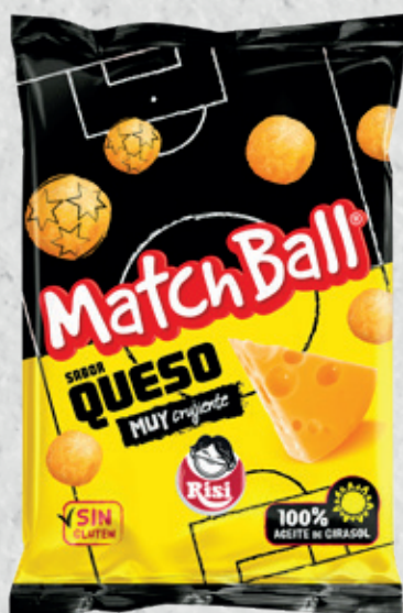
MatchBall 105 g