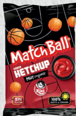
MatchBall Ketchup 30 g