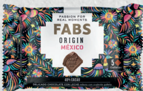
FABS ORIGIN México 41 g