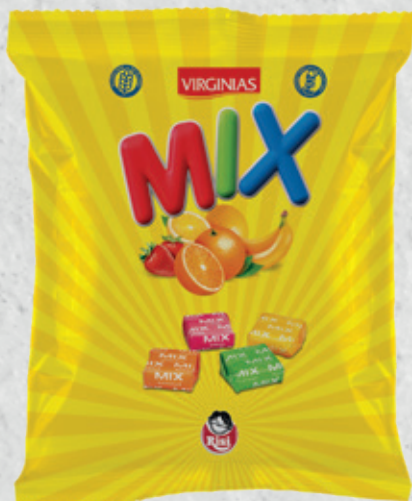
MIX Surtido Frutas 70 g