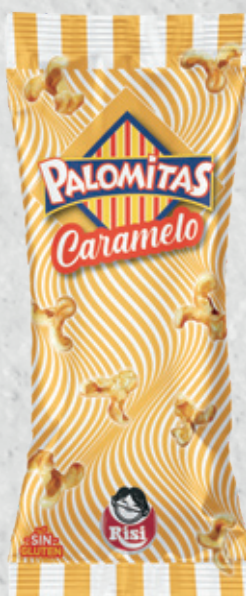
Palomitas Caramelo 80 g