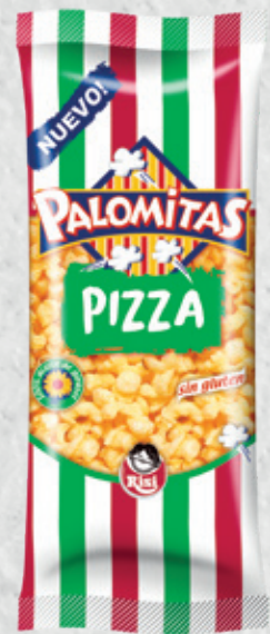
Palomitas Pizza 35 g