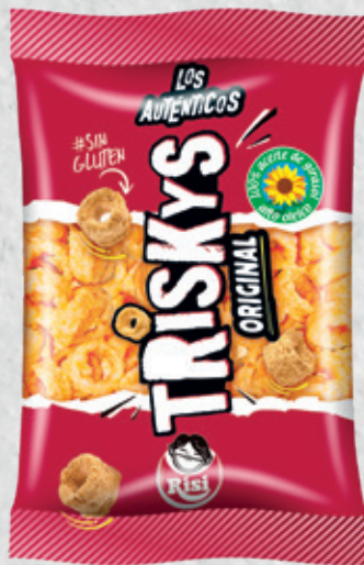
Triskys 35 g