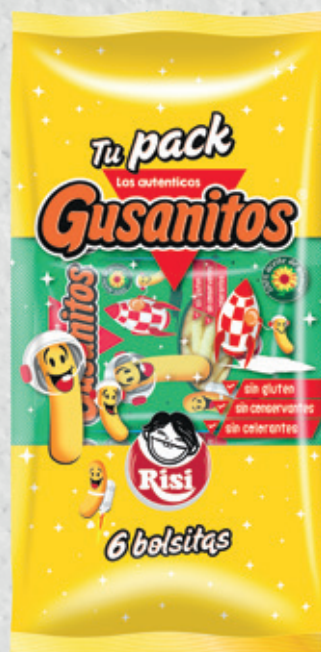
Pack Gusanitos 108 g