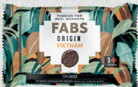
FABS ORIGIN Vietnam 44 g