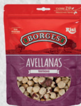
Avellanas Tostadas 80 g