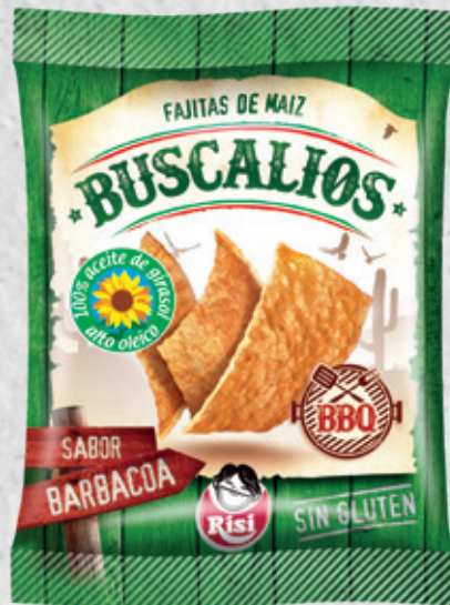
Buscalios BBQ 35 g