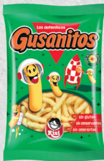
Gusanitos 35 g