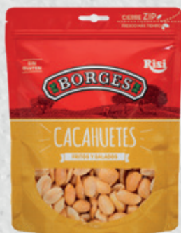
Cacahuetes Fritos y Salados 110 g