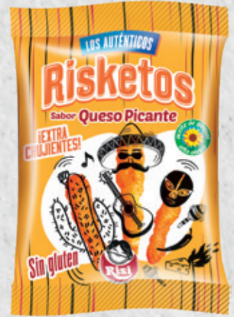
Risketos Queso Picante 40 g