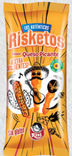
Risketos Queso Picante 120 g