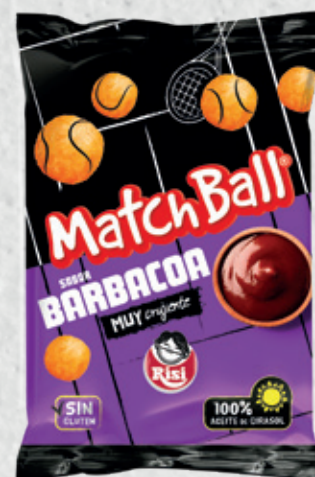
MatchBall BBQ 30 g