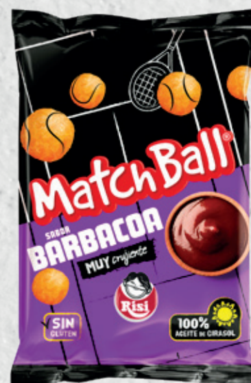
MatchBall BBQ 105 g