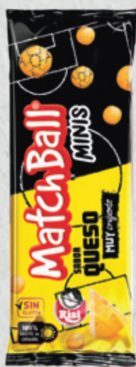
MatchBall Minis 27 g