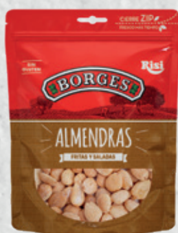
Almendras Fritas y Saladas 90 g