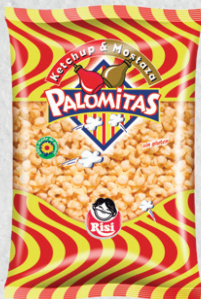
Palomitas Ketchup & Mostaza 90 g