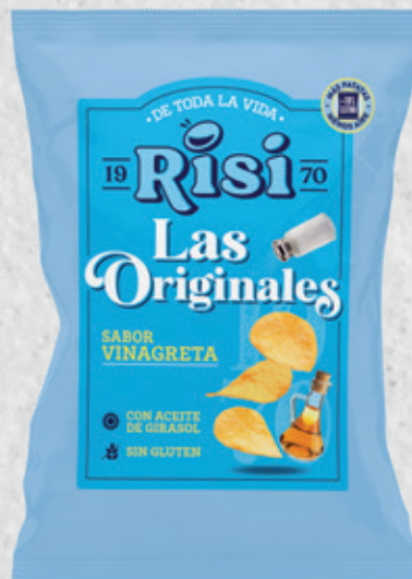
Patatas Originales Vinagreta 100 g