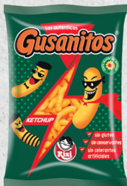
Gusanitos Ketchup 85 g