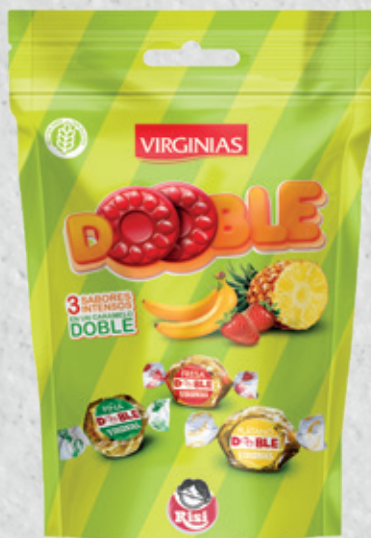
Dooble 70 g