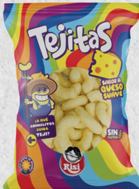
Tejitas 100 g