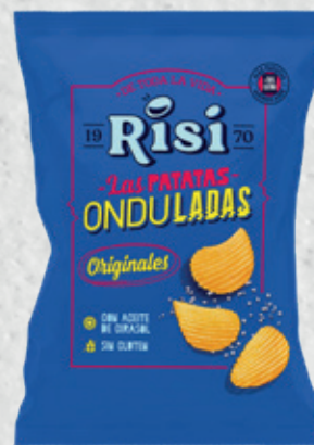
Patatas Onduladas Originales 100 g