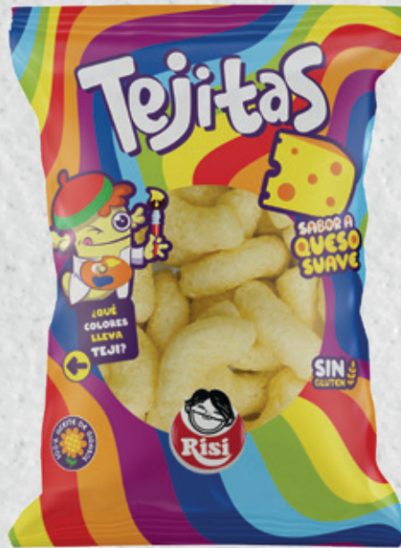
Tejitas 35 g