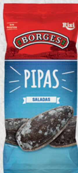
Pipas Saladas 100 g