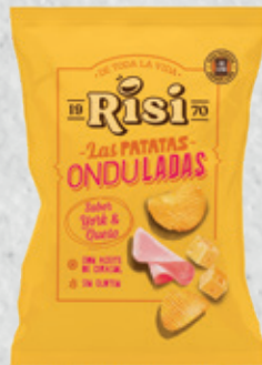
Patatas Onduladas York & Queso 40 g