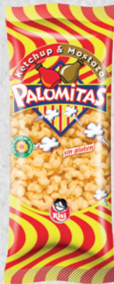
Palomitas Ketchup & Mostaza 35 g