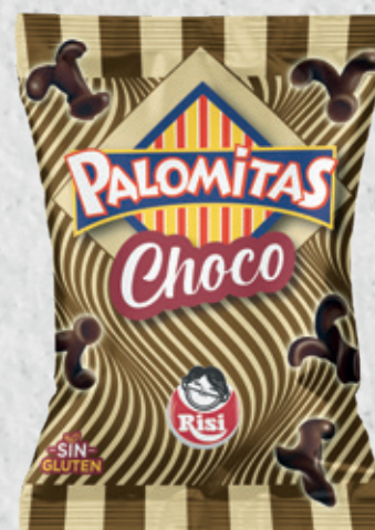
Palomitas Choco 30 g