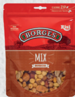
MIX Barbacoa 100 g