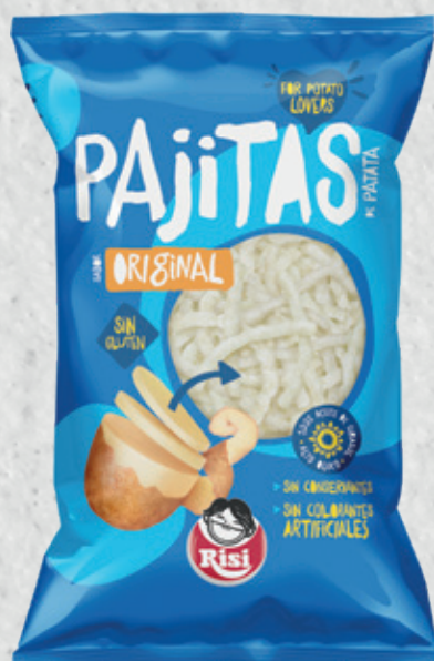
Pajitas de Patata 100 g