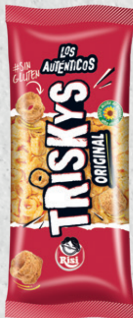
Triskys 115 g