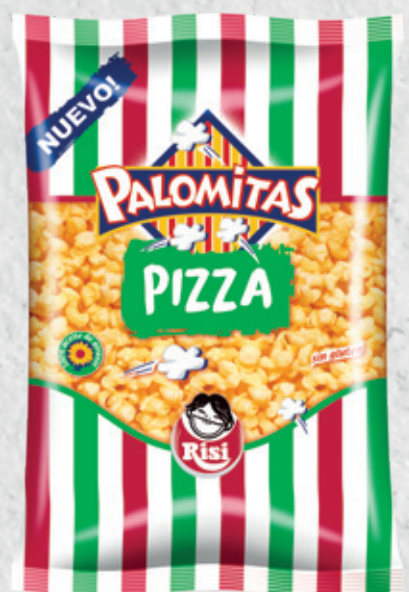
Palomitas Pizza 90 g