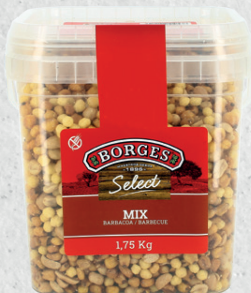
MIX Barbacoa 1,75 Kg