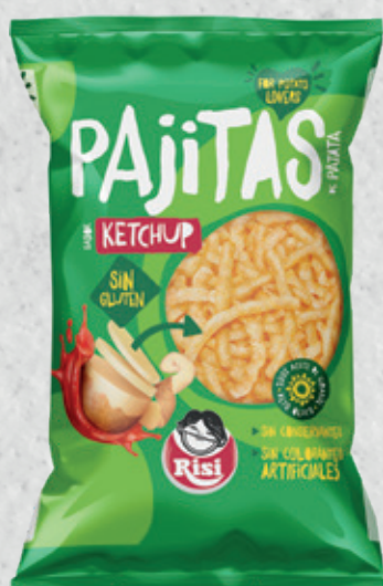
Pajitas de Patata Ketchup 12 g