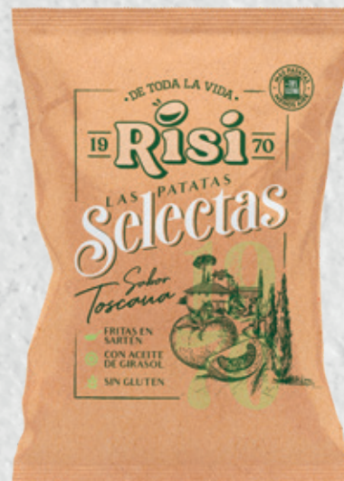
Patatas Selecta Toscana 100 g