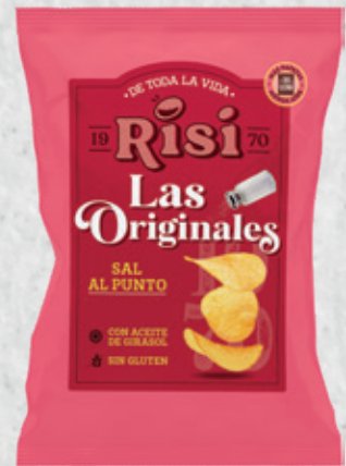
Patatas Originales Sal al Punto 40 g