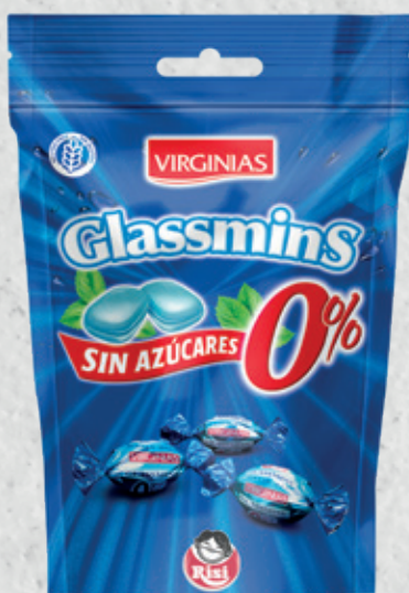
Glassmins Sin Azúcares 0% 70 g