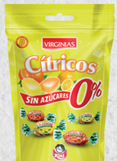
Cítricos Sin Azúcares 0% 70 g