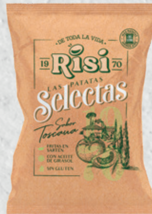
Patatas Selecta Toscana 40 g