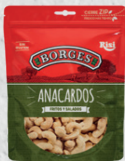
Anacardos Fritos y Salados 80 g