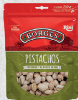
Pistachos Tostados y al Punto de Sal 80 g