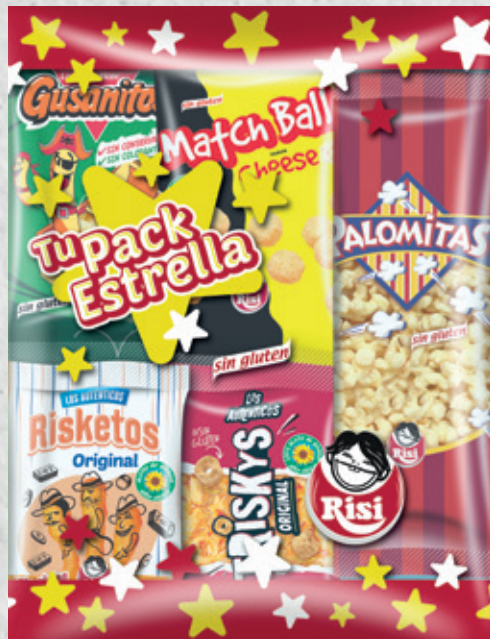
Pack Estrella 125 g