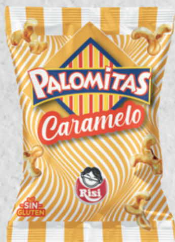
Palomitas Caramelo 30 g