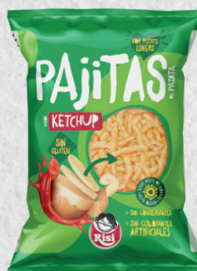
Pajitas de Patata Ketchup 20 g