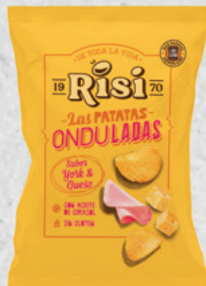
Patatas Onduladas York & Queso 100 g