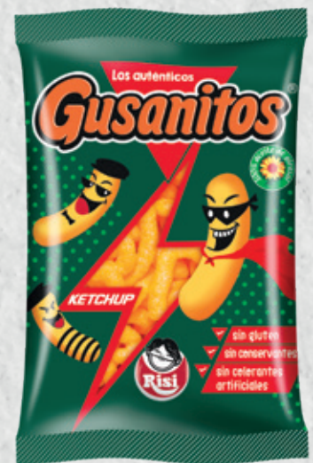
Gusanitos Ketchup 35 g