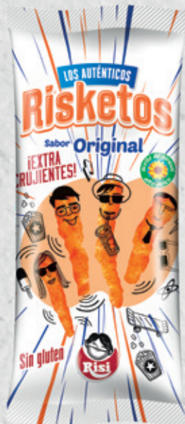
Risketos Original 120 g