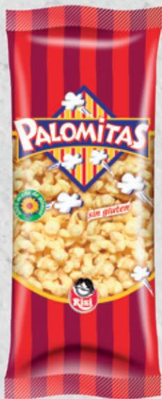
Palomitas 35 g