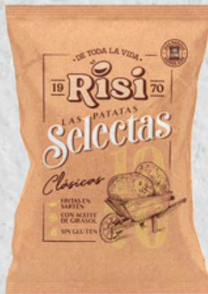
Patatas Selecta Clásica 40 g