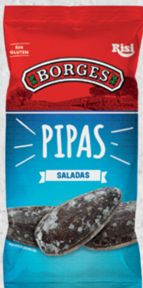
Pipas Saladas 40 g