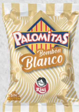
Palomitas Bombón Blanco 30 g