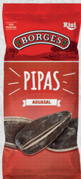
Pipas Aguasal 100 g