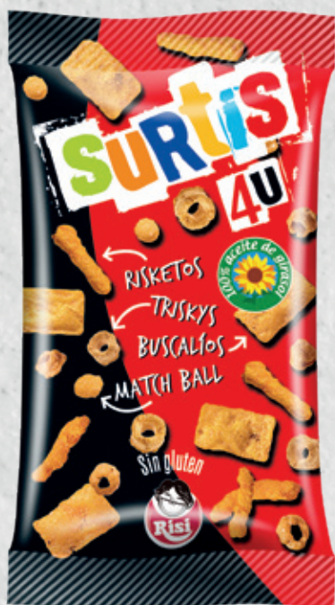
Surtis 4U 37 g