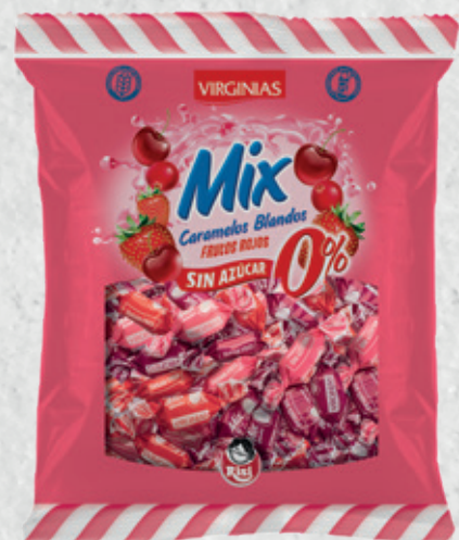
MIX Sin Azúcar 0% Frutos Rojos 70 g