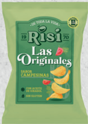
Patatas Originales Campesinas 40 g