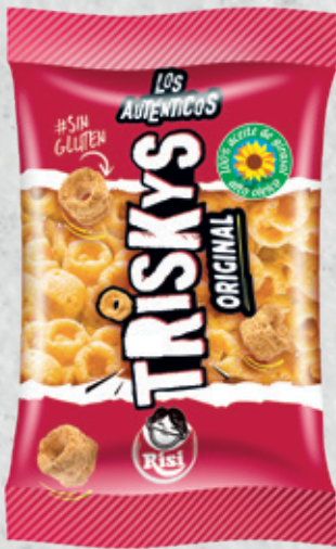
Triskys 20 g