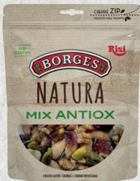
Natura MIX ANTIOX 100 g