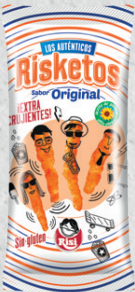
Risketos Original 80 g