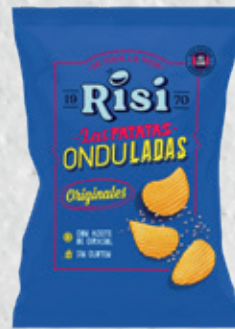
Patatas Onduladas Originales 40 g