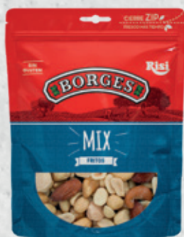
MIX Fritos 100 g