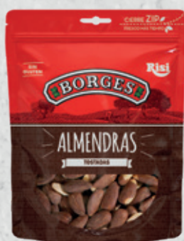
Almendras Tostadas 85 g