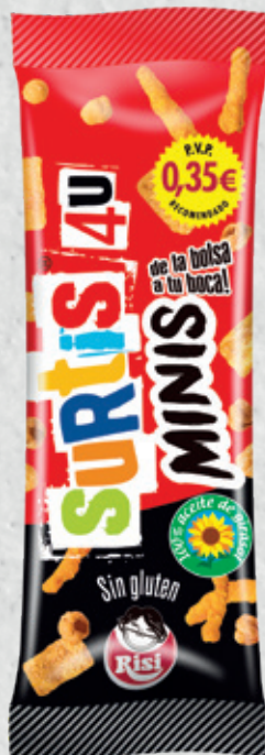
Surtis Mini 4U 37 g