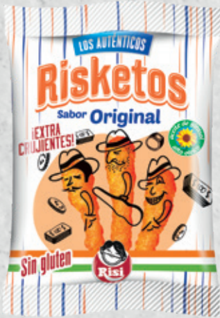
Risketos Original 40 g