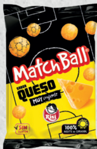
MatchBall 30 g