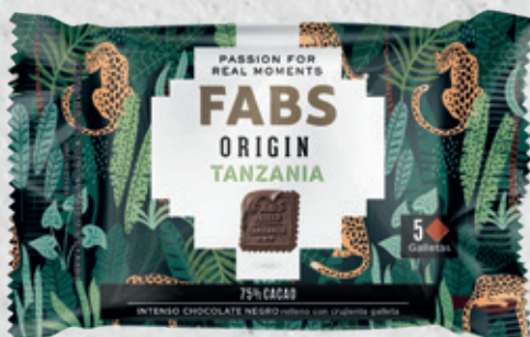
FABS ORIGIN Tanzania 41 g