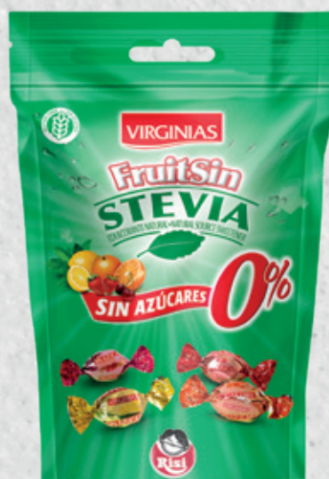
Fruitsin Stevia Sin Azúcares 0% 70 g