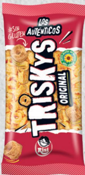
Triskys 85 g