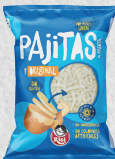
Pajitas de Patata 20 g