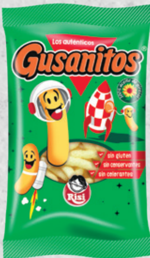
Gusanitos 18 g