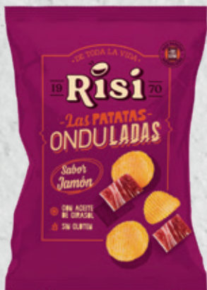
Patatas Onduladas Jamón 100 g