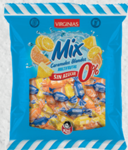
MIX Sin Azúcar 0% Multifrutas 70 g