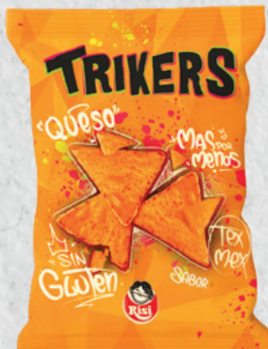
Trikers 45 g