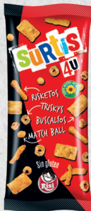
Surtis 4U 110 g